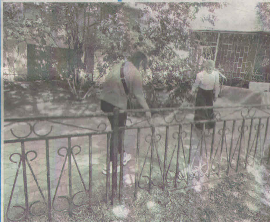
В Жанааркинском и Улытауском