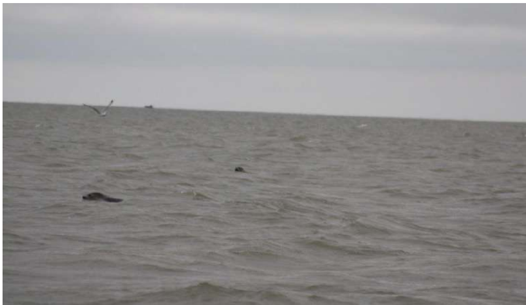
Рисунок 2. Характерные положения тюленя рядом с движущейся моторной лодкой (предустьевое пространство реки Урал, 18.11.2015 г.,)

измерение дальности. Кроме того, тюлени всплывают неожиданно, периодически ныряют и не постоянно сопровождают судно, движущееся со скоростью около 7–10 узлов. Шум двигателя, приближение судна и время наблюдений, преимущественно — апрель или октябрь, позволяют с большой долей уверенности утверждать, что тюлени не пребывают в спокойствии — лежащими в воде, и будут встречаться в позиции плывущих или наблюдающих — высунувших из воды голову (рис. 2). Поэтому и размеры объектов № 2 и № 3 имитировали именно эти положения тюленей.