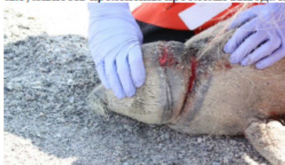
Рис. 2. Обрывки сети на шее каспийского тюленя в районе Прорвы

Интервьюирование рыбаков показало, что в последние годы кутум стал многочислен и часто улавливается сетями в большом количестве. Ввиду этого, опасаясь штрафных санкций, рыбаки вынуждены оставлять сети в море, не выбирая их. Это повышает риск попадания в брошенные сети и каспийского тюленя. Несмотря на кажущуюся несвязанность с вопросом сохранения каспийского тюленя, все же хотелось обратить внимание на актуальность проявления проблемы вывода кутума из Красной книги РК.