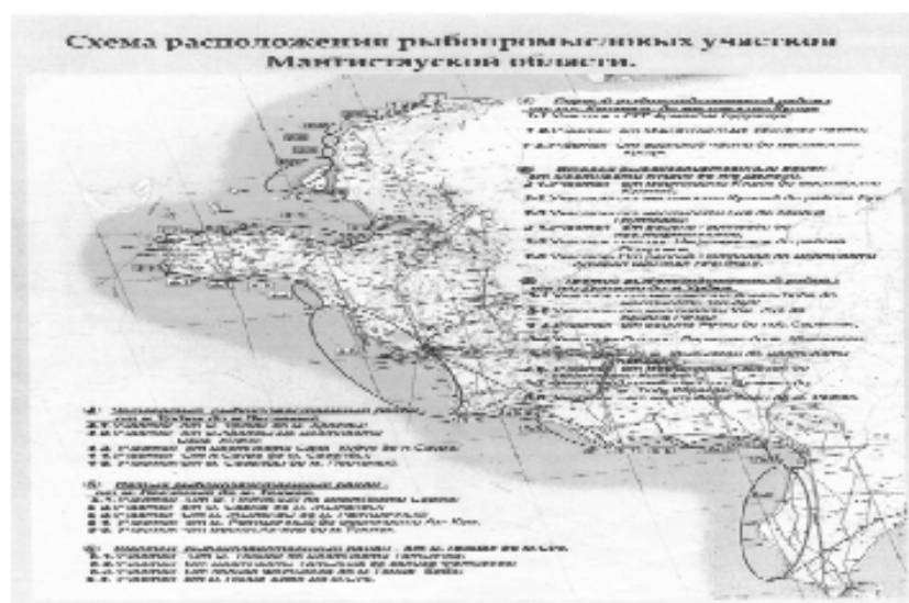
Рис. 1. Схема расположения рыбопромысловых участков Мангистауской области.

сазан (57,89%), судак (42,11%), лещ (42,11%), вобла (36,84%), кутум (26,32%), жерех (10,53%), осетр (5,26%).